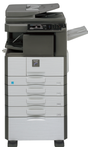
MX-M316N, modelo mostrado.

SISTEMA MULTIFUNCIONAL A3 BLANCO Y NEGRO CON DISEÑO FLEXIBLE PREPARADO PARA RED